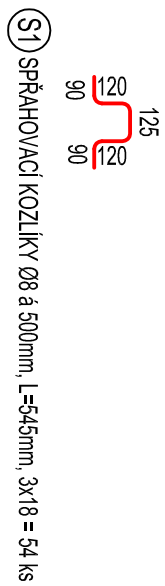
S1 SPÁJOVACÍ KOZLÍKY Ø8 a 50mm, L=54mm, 3x/3 = 54 ks

K1 KONSTRUKČNÍ VÝZTUŽ PŘÍLEHLÝCH OBOJNÍKŮ PŘI SPODNÍM HODNĚNÍ LČI SÍŤ KARI KY50 Ø8-50 / Ø8-50, Bx=200x300mm, 2x3+1x1 = 7 ks MIN. VZÁKLENÉ PŘESAHY Z OKA = 300mm